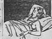
Sueño tranquilo y reparador gracias a las tabletas de ADALINA

Los funerales fueron muy concurridos, ya que en esta forma se quiso testimoniar el afecto que se le tenía. DIARIO DE COSTA RICA hace presente su sentido condoleencia a la familia doliente.